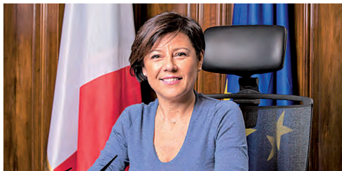
Il ministro Paola De Micheli