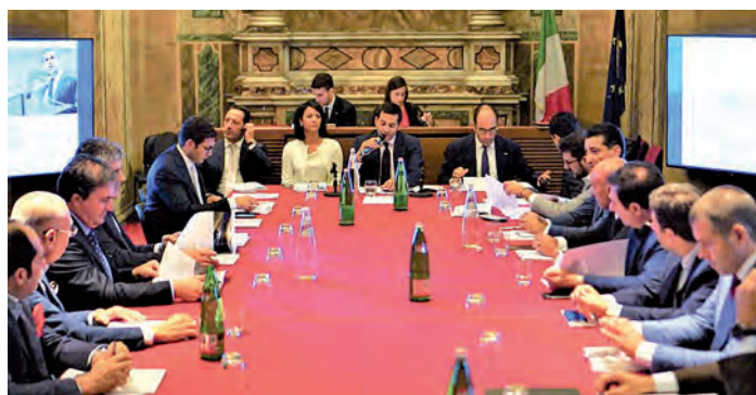
Riunione del consiglio direttivo di Alis

“La profonda vocazione internazionale e l'allargamento della compagine associativa per far sistema a 360 gradi è testimoniata tanto dai nuovi soci effettivi, aziende leader dei rispettivi settori che rafforzano ulteriormente la rappresentatività del nostro cluster, quanto dai nuovi soci onorari, che in-