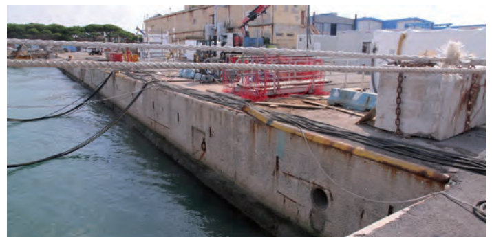
Cavi elettrici lasciati a pelo d'acqua

La situazione ha dell'incredibile. Infatti, stando a quanto rilevato dagli ispettori Jobson, oltre al perseverante dispregio dell'ordinanza di demolizione e sgombero dell'AdSp n. 5/2019 (bell'esemplare di grida spagnolesca), ulteriormente violata addirittura con la collocazione di un'altra cabina, è stata constatata la presenza di nuove invasive perforazioni praticate sul suolo in cemento armato del cavedio del bacino in muratura e ciò sebbene, a solo circa due metri, esistesse già un foro antecedente dove si vede anche un "gargherozzo" tranciato che inghiotte l'acqua piovana provocando l'allagamento del sotterraneo. A proposito di quanto una ventina di giorni fa abbiamo cercato, forse anche maldestramente, di illustrare (del resto, tanto scempio significar per verba non si porria), risulta che Jobson, con una nota