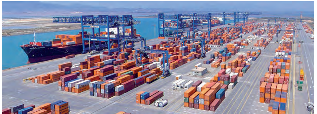
Una veduta del Cagliari international container terminal

Un passo fondamentale per il quale l'Autorità di Sistema portuale del mare di Sardegna pro-