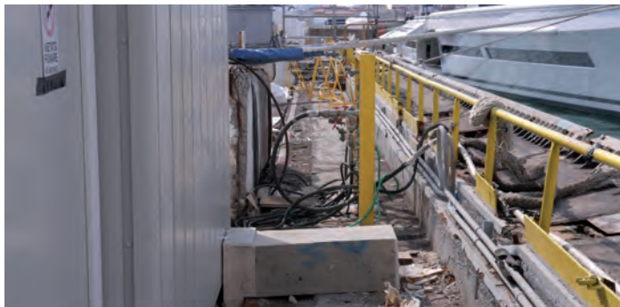
Immagine del bacino manomessa

Si tratta di una situazione che definire imbarazzante ed anomala è assolutamente riduttivo e che può significativamente concorrere a spiegare, almeno in parte, l'inaudita durata della gara stessa che si protrae ormai dal 2015. Certo è che tale incredibile temporeggiare non potrà essere protratto all'infinito e, se i nodi che di volta in volta vengono denunciati ci sono davvero, finiranno inevitabilmente per venire al pettine. In queste ultime ore si sono intesi.....sussurri secondo i quali l'Authority che avrebbe addirittura autorizzato lo smontaggio degli armadi elettrici ed accessori scomparsi dall'edificio numero uno-servizi generali dell'area bacini. Il fatto potrebbe essersi verificato in margine ad uno pseudo bando – mai pubblicato – risalente al 2006 e potrebbe essere consistito nella rimozione di alcuni trasformatori ad olio considerati fuori norma. Ne riferiamo per completezza di informazione, ma non ci crediamo né vogliamo crederci. Ciò non di meno cercheremo di veder più chiaro in tale paradosso.