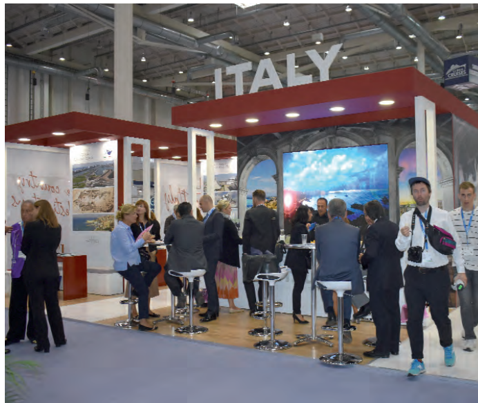
Lo stand "Italy" di Assoporti al Seatrade Europe

L'aumento del turn around permetterà, inoltre, un'ulteriore crescita di tutti i servizi collaterali al settore crocieristico con risvolti decisamente favorevoli per l'economia del territorio.