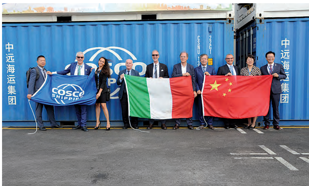
Delegazione italiana e cinese prima della partenza dei contenitori

Insomma, una vetrina gigantesca della produzione mondiale,