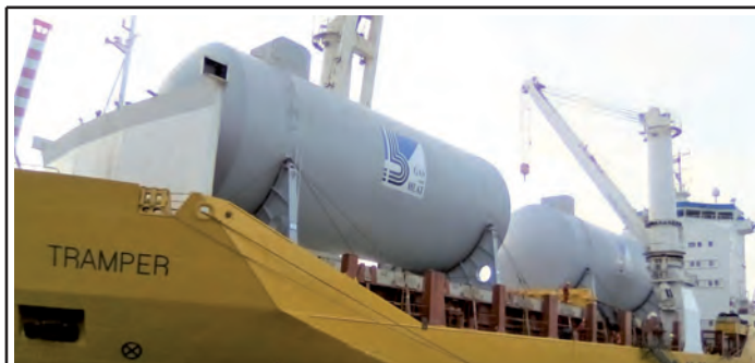
Serbatoi Gas and Heat a bordo del Tramper

Il servizio serve regolarmente 14 porti: Gioia Tauro, Civitavecchia, Livorno, Savona, Valencia (Spagna), Anversa (Belgio), Halifax (Canada), gli scali statunitensi di Davisville, New York, Baltimora, Jacksonville e Houston, nonché quelli messicani di Tuxpan e Veracruz.