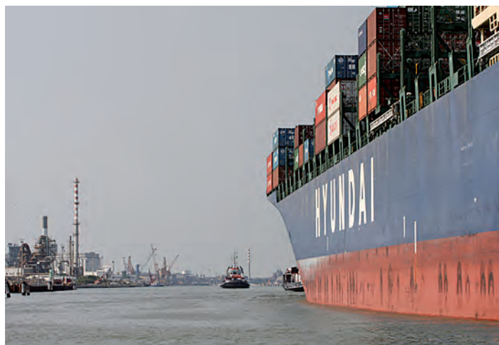
Unità Hyundai all'ormeggio a Venezia

deve essere più aperta e condivisa con i Paesi e con le aree lungo le quali si sviluppa, in maniera sostenibile non solo in termini ambientali, ma anche sotto il profilo della fattibilità e tenuta economica e finanziaria dei vari progetti ricadenti dentro questo grande contenitore". "L'Europa – conclude il presidente dell'Autorità di Sistema portuale – si trova nella situazione di poter espandere la propria sfera d'influenza ma ciò potrà avvenire solo in presenza di una strategia sovranazionale coerente, che permetta di conseguire accordi di interesse reciproco con il partner cinese. E' un approccio che, a Venezia, stiamo praticando da tempo, avendo siglato negli ultimi mesi intese commerciali mirate a moltiplicare i traffici e a creare ricadute positive in termini di valore e occupazione nella nostra area di riferimento, accompagnando questi accordi con interventi infrastrutturali mirati che garantiscano l'aumento della competitività dello scalo e dell'intera catena logistica".