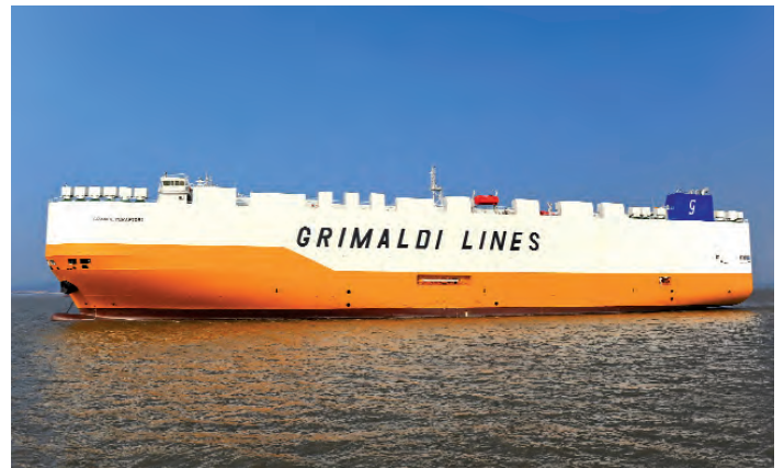
La "Grande Mirafiori" in navigazione

È, infatti, dotata di un motore Man Energy Solutions a controllo elettronico, come richiesto dalle nuove normative per la riduzione delle emissioni di ossido di azoto (NOx), nonché di un sistema di depurazione dei gas di scarico per l'abbattimento delle emissioni di ossido di zolfo (SOx). Infine, rispetta le più recenti normative in termini di trattamento delle acque di zavorra.