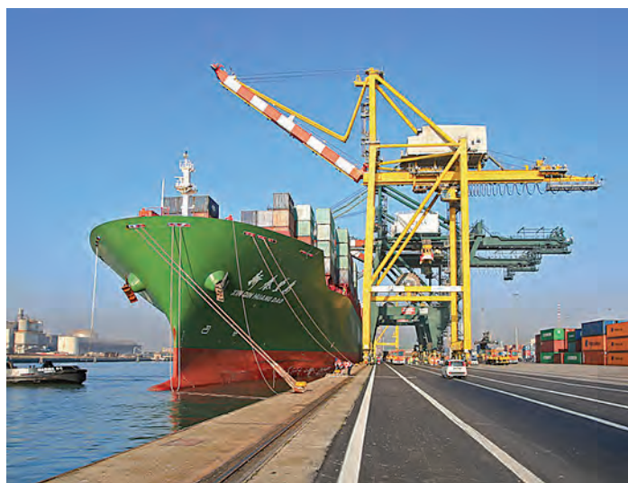
Fullcontainer sottocarico nello scalo lagunare